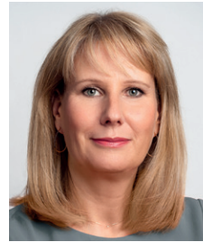
Silvia Schmitt-Walgenbach Ehem. Vorstandsvorsitzende bei der CA Immo/Aufsichtsrätin